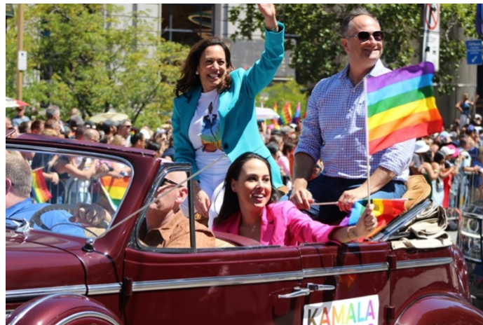
La vicepresidenta Harris en el Desfile del Orgullo Gay en San Francisco, California