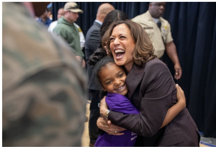
La vicepresidenta Harris abraza a un joven partidario

Como senadora, la vicepresidenta Harris lideró la legislación para reformar las fianzas en efectivo, combatir el hambre, proveer ayuda con el pago de la renta, mejorar los cuidados de salud materno infantil y, enfrentar la crisis climática como miembro del Comité del Medioambiente y Obras Públicas del Senado. Su proyecto de ley bipartidista anti linchamientos fue aprobado en el Senado en 2018. Su legislación para preservar los institutos y universidades históricamente negros (HBCU, por sus siglas en inglés) fue firmada como ley, así como su esfuerzo para proveer capital muy necesario a comunidades de ingresos bajos durante la pandemia del COVID-19.