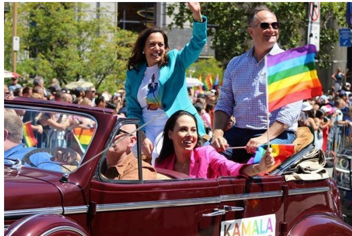
La vicepresidenta Harris en el Desfile del Orgullo Gay en San Francisco (California)

En 2010, la vicepresidenta Harris fue elegida fiscal general de California, donde supervisó al departamento de justicia estatal más grande del país. Se enfrentó a quienes se aprovechaban del pueblo estadounidense, consiguiendo un acuerdo de $20,000 millones para los californianos cuyas viviendas habían sido embargadas y un acuerdo de $1,100 millones para estudiantes y veteranos de guerra de los que se había aprovechado una empresa de educación con fines de lucro. También defendió ante los tribunales la Ley del Cuidado de Salud a Bajo Precio e hizo cumplir leyes medioambientales.