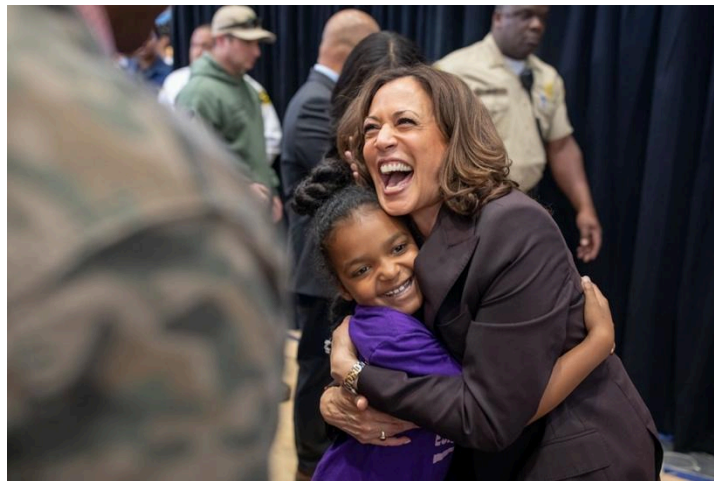
Vice President Harris embraces a young supporter

Como pionera a lo largo de toda su carrera, la vicepresidenta se ha comprometido a cumplir el consejo de su madre: "Kamala, puede que seas la primera en hacer muchas cosas, pero asegúrate de no ser la última".